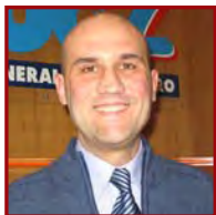
a cura di FERNANDO CORDELLA Coordinatore Nazionale UGL

I n data 13 aprile con una lettera indirizzata al Ministro dell'Interno si ricordava che sono passati più di cinque mesi da quando il Consiglio dei Ministri, al fine di salvaguardare la piena operatività del sistema nazionale di soccorso tecnico urgente assicurato dal Corpo Nazionale dei